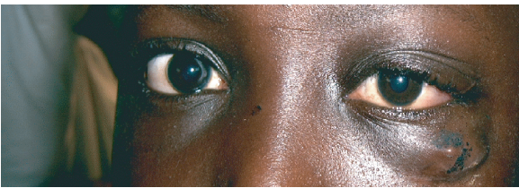
FIGURE 2: Image de la face montrant la tuméfaction de la paupière inférieure gauche et une hyperhémie conjonctivale homolatérale (vue de face).

les parents interrogés, ce garçon ne s'était jamais plaint de troubles visuels, ni de douleur oculaire, même à distance de la période l'accident. Les soins des lésions locales avaient été faits après le traumatisme et l'évolution simple.