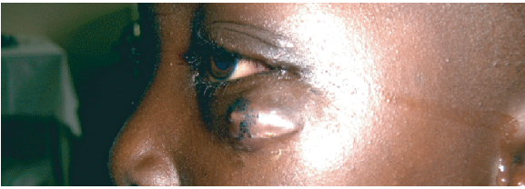
FIGURE 1: Image de la face, vue de profil montrant une tuméfaction centrée par un point et entourée d'une zone hyper pigmentée au niveau de la paupière inférieure gauche.