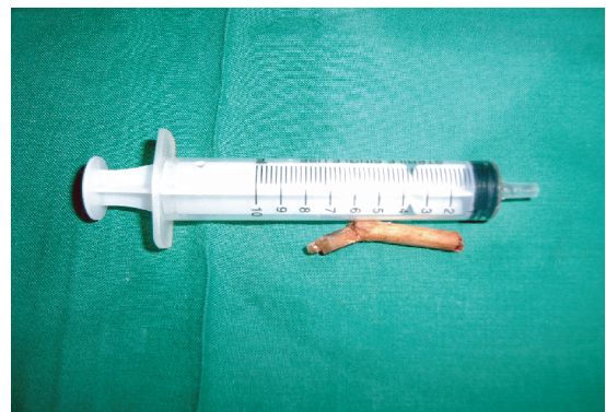
FIGURE 4: Image d'un fragment de bois d'environ trois centimètres de long extrait de la paupière inférieure gauche.

peut se révéler par des complications dont certaines sont susceptibles d'engager le pronostic fonctionnel de l'œil [9]. Les signes d'appel sont disparates. Le cas que nous avons décrit s'est présenté sous forme d'un abcès orbitaire avec une induration centrale. Dans une étude coréenne, les auteurs ont rapporté un cas où le patient avait une exo-déviation [9]. Dans d'autres études, le tableau était dominé par la diplopie [5, 19] et la douleur avec trouble de l'oculomotricité [5].